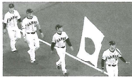
WBC 国旗を持って試合前セレモニーに臨む 大谷翔平選手

目指す学校像は「明るい教育環境で学力向上を目指す学校」としました。明るい教育環境とは、教室環境を始めとした学校全体の物的環境と『最大の教育環境は教員である』と言われるように人的環境(教員)を指します。言動、服装等に「教育公務員としての常識」をもつ教師が、本気になって全校生徒564名に向き合っていきます。