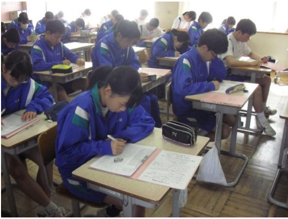
朝、コラムをひたすら視写する生徒(3の3教室)

熊本城全体の復旧完了は、今から26年後の52年度と見込まれているという。あれからもう10年か、それともまだ10年か。▼きおくしたしんさいのつめあとをおもいおこしあすのわがみにそなえたいとあらためておもった▼